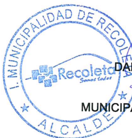
DANIEL JADUE JADUE ALCALDE MUNICIPALIDAD DE RECOLETA